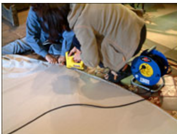
Mise en tension d'une toile de rentoilage

Les opérations de refixage contiennent aussi des techniques et des matériaux traditionnels et modernes. Il ont lieu pour résoudre les problèmes de déplacements, de soulèvements, les cloques et autres problèmes de cohésion entre les différents feuillets du tableau ou avec le support. Il est à noter que les problèmes de déformation du support et les problèmes de cohésion ne sont pas toujours liés. Ainsi, si un support déformé va presque irrémédiablement entraîner des problèmes de cohésion sur les matériaux, un problème de cohésion ne provient pas forcément d'une dégradation du support.